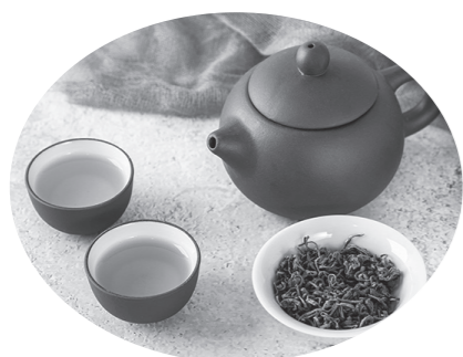
연한 차 마시기

우리는 일상생활에서 콩을 많이 먹는 습관이 있다. 2023년 《심장병학》에 발표된 종술에 의하면 2020년 6만 명 이상의 사람들을 대상으로 연구한 결과 하루에 125그램 이상의 콩제품을 섭취하는 사람들은 125그램 미만을 섭취하는 사람들보다 고혈압 위험이 27% 떨어졌다.