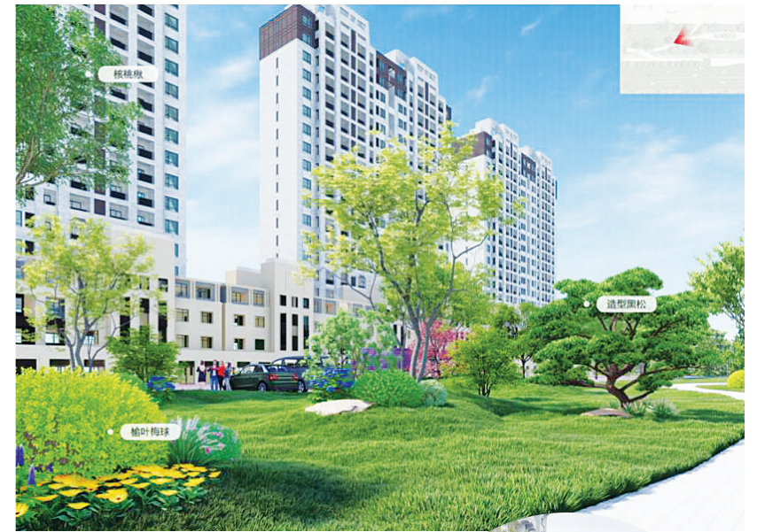
▲ 자형원 유원지 효과도

올해는 '연길록화미화'를 실시하는 관건적인 해이다. 연길시는 '연길록화미화'의 주요 전장으로서 중점적인 역할을 두드러지게 발휘하여 올해 중화민족공동체 의식 확고히 다지기 주제 유원지, 광진거리 미니공원, 자형원 유원지 등 11개의 유원지를 건설할 예정이다.